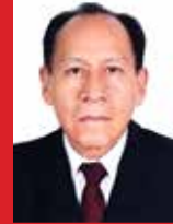
Por: Eleuterio Soto Salas Subgerencia Compensaciones Gerencia de RR.HH.

En la década del 70 entran masivamente las máquinas de escribir y sumar mecánicas. De la buena letra se pasa a la agilidad y la velocidad en los dedos, el tecleo incesante de estas máquinas comienzan a agitar las oficinas del BN, los golpes del sello PAGADO o RECIBIDO, que los RPs estampaban en los cheques, aumentaban el traqueteo diario.