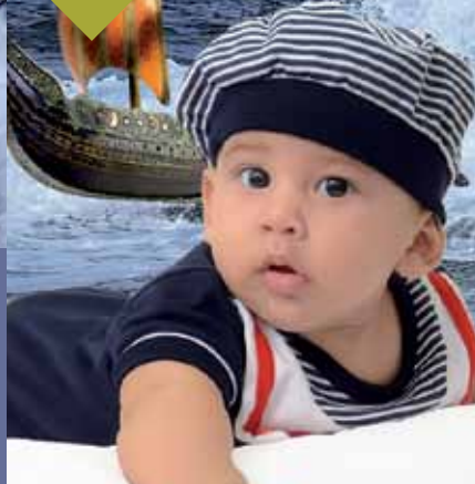
★ LEONARDO MARTÍN MAMÁ: MAGALY GARCÍA HIDALGO AGENCIA TARAPOTO