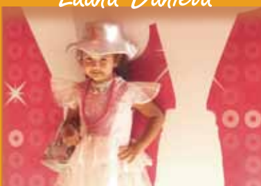
Nietecita de: Gina Mori Sánchez Agencia Chachapoyas