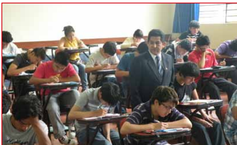
Proceso de Admisión 2013-I

El BN apoya y siempre estará disponible para este tipo de iniciativas provenientes de cualquier institución, cuyas actividades fortalezcan nuestra acción social.