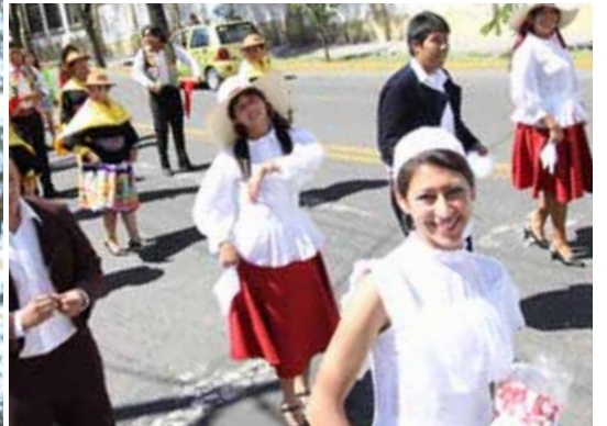
El 28 de Abril a las 11:00 horas se inició el desfile de las delegaciones. Participaron la banda musical de la Policía de Arequipa y un grupo de danzantes, representando a la Costa, Sierra y Selva. Cada delegación hacía uso de pancartas, globos y mascotas deportivas.