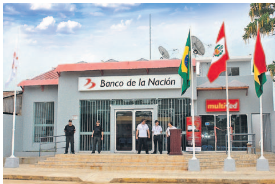
AGENCIA IÑAPARI. Así como este local, ubicado en el límite con Brasil y Bolivia, el Banco de la Nación se encuentra presente en cada una de las fronteras del país.