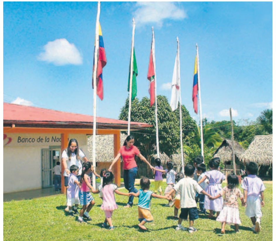
AGENCIA SOPLÍN VARGAS. El banco de todos los peruanos se encuentra en el 100% de provincias del país, facilitando el acceso a una banca con inclusión social.