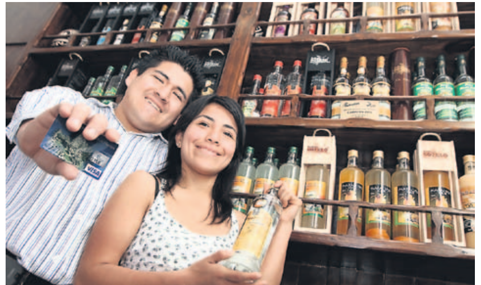
APOYO. Cada vez son más las mypes beneficiadas.

son las IFIs que mantienen una alianza estratégica con el Banco de la Nación para otorgar créditos en los lugares donde esta entidad estatal es la Única Oferta Bancaria.