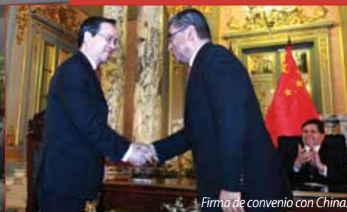
Firma de convenio con China.