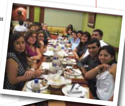
Sus familiares siguen de cerca sus logros.