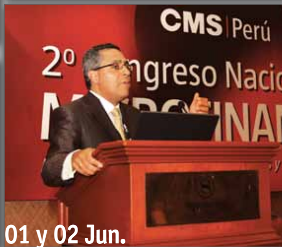
01 y 02 Jun.