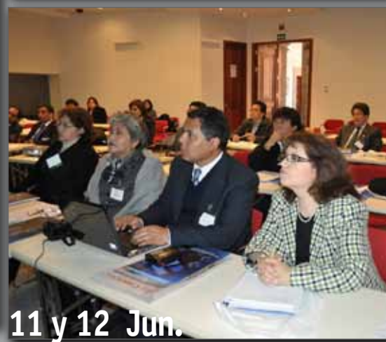
11 y 12 Jun.