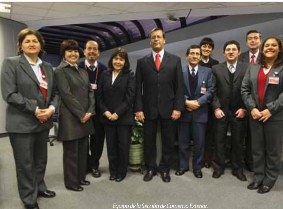
Equipo de la Sección de Comercio Exterior.