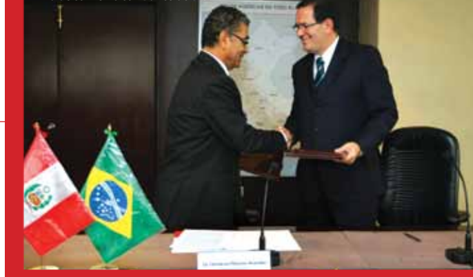
Firma de convenio con Banco do Brasil

apoyar los esfuerzos que viene liderando el Estado Peruano en temas de interés nacional, tales como consolidar el proceso de bancarización (en el presente caso con mayor énfasis en la zona de frontera Perú-Brasil), impulsar el intercambio comercial bilateral, así como facilitar el establecimiento de canales alternativos para que los peruanos en el exterior, realicen operaciones bancarias (como remesas familiares), actuando el Banco do Brasil a través de sus sucursales en lugares de gran concentración de inmigrantes peruanos, como es el caso de Japón y otras ciudades.