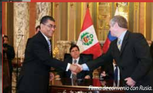
Firma de convenio con Rusia.

existen proyectos en evaluación de microempresarios regionales. Además, se ha previsto que los beneficios de la cooperación China se hagan extensivos a las empresas privadas, a través de la participación de entidades bancarias locales como canalizadores de los recursos financieros de la cooperación.