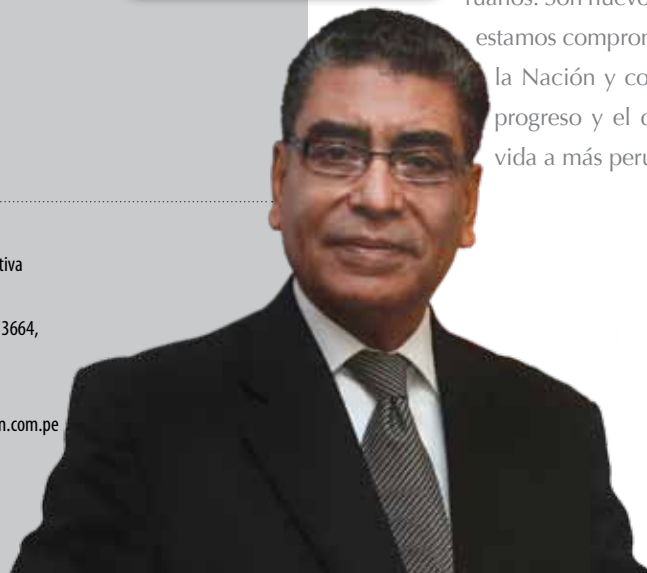
Humberto Meneses Arancibia Presidente Ejecutivo

Para hacer esto posible necesitamos del apoyo permanente de cada uno de los integrantes de este conjunto humano que conduce los destinos de la entidad bancaria de todos los peruanos. Son nuevos los retos y metas propuestas en los cuales estamos comprometidos. Renovemos los votos de servicio a la Nación y continuemos caminando por el sendero del progreso y el desarrollo institucional para cambiarles la vida a más peruanos.