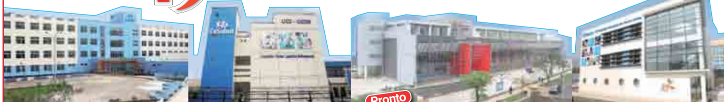
Clínica Geriátrica SAN ISIDRO LABRADOR - Ate

19 Hospitales 9 ya fueron entregados y 10 en marcha