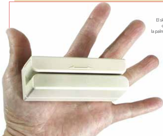
El skimmer cabe en la palma de la mano

Ante cualquier duda, mantenga la calma y comuníquese inmediatamente con la División Seguridad (Centro de Control de Emergencias- 211-8830 anexos 11263, 11370, 11374 y 11455, quienes coordinarán con la Unidad especializada. (DIRINCRI-DIVINSEC Telf. 431-8047).