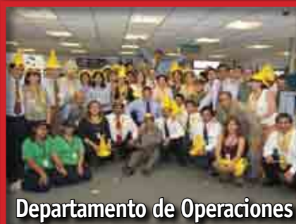
Departamento de Operaciones