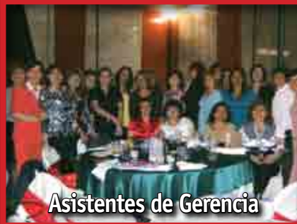
Asistentes de Gerencia