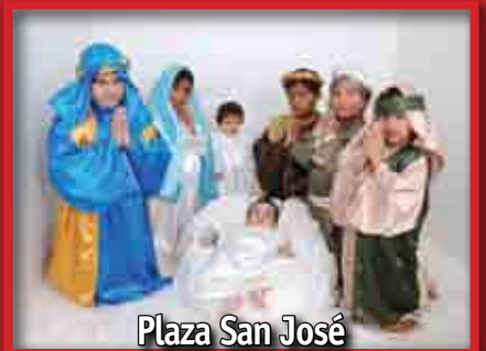
Plaza San José