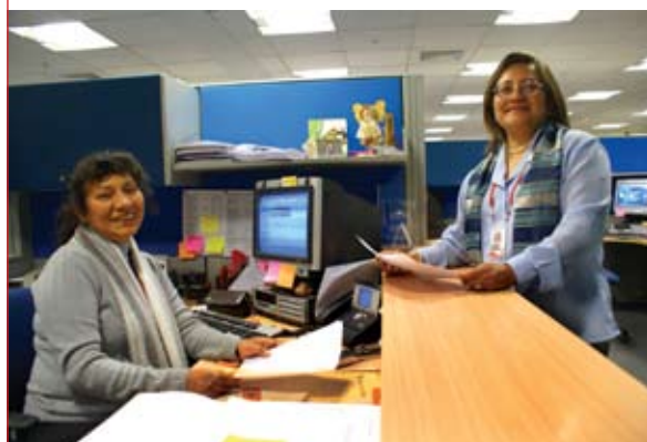
Con cordialidad y suma amabilidad se desempeñan las señoras de esta área.

Trabajar en bien del personal, de sus pensionistas y cesantes es la principal tarea de los que conforman las divisiones de este departamento, un área dedicada íntegramente al bienestar de todos sus trabajadores manteniendo un equilibrio que favorezca a ambas partes