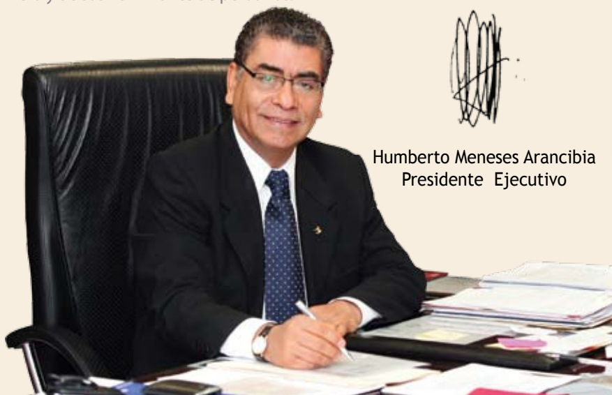
Humberto Meneses Arancibia Presidente Ejecutivo

Con la convicción del rol fundamental que cumple nuestra institución renovamos el compromiso de seguir al frente del apoyo al desarrollo económico del Perú y de sus 28 millones de peruanos.