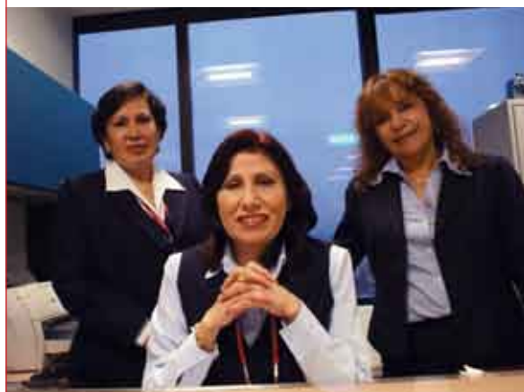
El visitante es cordialmente atendido por las secretarías de esta área.

El Departamento de Asesoría Jurídica funciona como órgano de asesoramiento y apoyo para sus distintas áreas operativas.