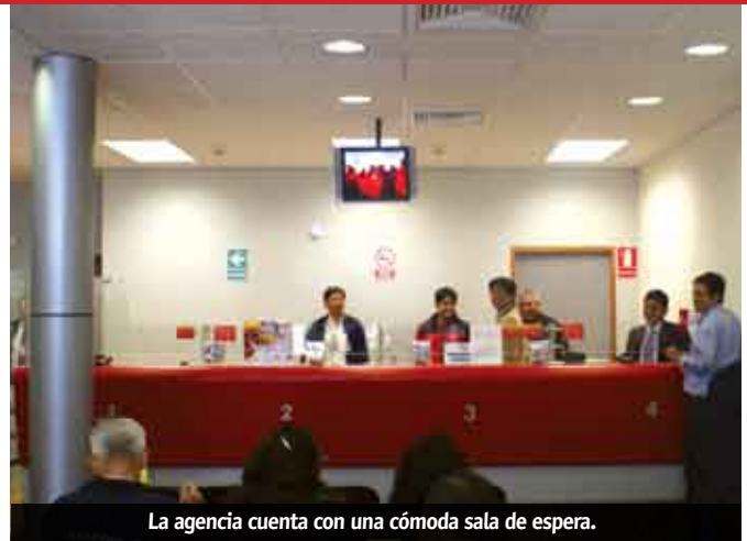
La agencia cuenta con una cómoda sala de espera.

que este préstamo le permitirá mejorar su bodega que ya tiene nueve años de funcionamiento, pero necesita un impulso para elevar sus ganancias.