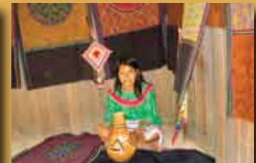
Soledad Ccoicca Quispe