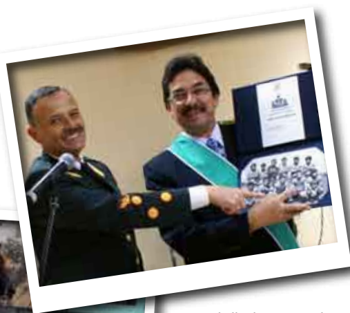
Caballo de paso en plena marinera norteña en honor a la presencia del BN en la escuela policial.