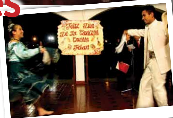
La marinera norteña estuvo presente en la celebración del día de la canción criolla.

El Club La Calera se llenó de luz y color para recibir a decenas de personas ansiosas de celebrar por anticipado el Día de la Canción Criolla en medio de cantos, cajones y guitarras; y por supuesto con la presencia del grupo Sones y Raíces de la Nación que se encargó de hacer bailar a más de uno.