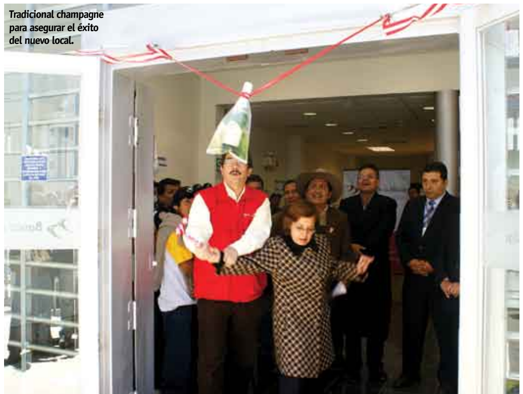
Tradicional champagne para asegurar el éxito del nuevo local.

La nueva agencia del Banco de la Nación, ubicada en la avenida San Martín 192, a media cuadra de la Plaza de Armas de Castrovirreyna tiene ahora el reto de poner en práctica esta nueva filosofía de gestión bancaria que cree en su gente, en sus valores, en sus costumbres, en su idiosincrasia y sobre todo en su esfuerzo.