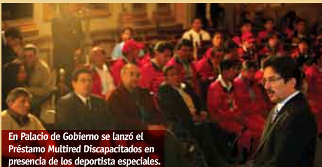
En Palacio de Gobierno se lanzó el Préstamo Multired Discapacitados en presencia de los deportista especiales.

En la ceremonia se premió a los deportistas especiales que han logrado lauros para nuestro país, dando un ejemplo de entrega que deberíamos seguir