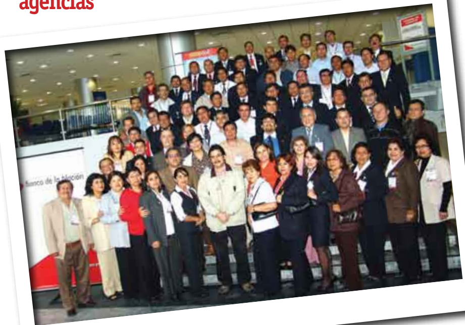
Reunidos los 54 administradores al final de la convención

Destacó que entre las actividades de este año figura la gran Feria de los Niños "Juvenalia 2007" que permitió posicionar al BN como un "banco de servicios" moderno y eficiente, que se preocupa por incentivar en los peruanos, desde su niñez, el valor del servicio a los ciudadanos de las diferentes regiones del país.