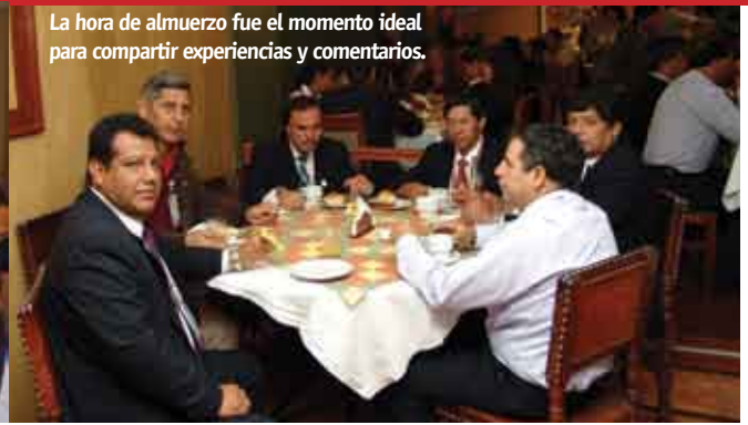
La hora de almuerzo fue el momento ideal para compartir experiencias y comentarios.

administradores de las agencias C, sólo se trabajaba a nivel de jefes de oficinas de categoría A y B.