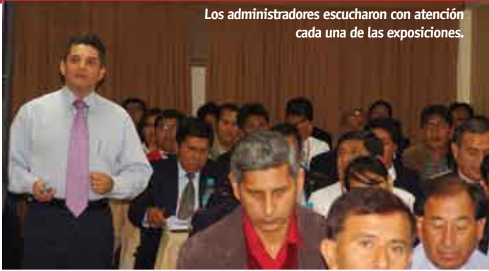
Los administradores escucharon con atención cada una de las exposiciones.