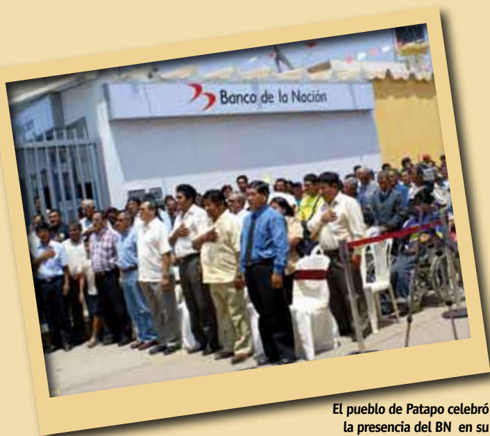
El pueblo de Patapo celebró la presencia del BN en su localidad.

Nuestra red de agencias sigue creciendo y en otros casos mejorando, esta vez la gira de trabajo por el norte también sirvió para que se entregaran las oficinas remodeladas de Talara, El Alto, Negritos, Chiclayo y Lambayeque, donde ahora brindamos un mejor servicio