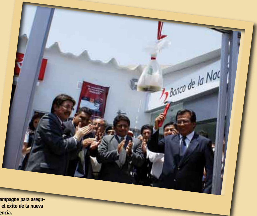
Champagne para asegurar el éxito de la nueva agencia.

En Negritos la presencia de los turistas nacionales y extranjeros va en aumento y el Banco de la Nación no podía estar ajeno al desarrollo de la localidad, por eso ha remodelado su agencia y con ello también contribuye a descongestionar la oficina de Talara