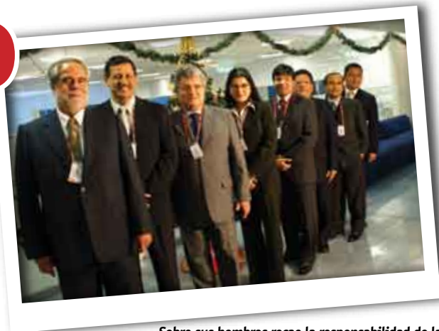
Sobre sus hombros recae la responsabilidad de la buena marcha del Departamento de Logística.

La labor que cumple diariamente el Departamento de Logística es amplia, variada e intensa, pero quienes trabajan en esta oficina tienen el suficiente espíritu para llevarla adelante con éxito y todavía se dan tiempo para plantearse nuevos retos