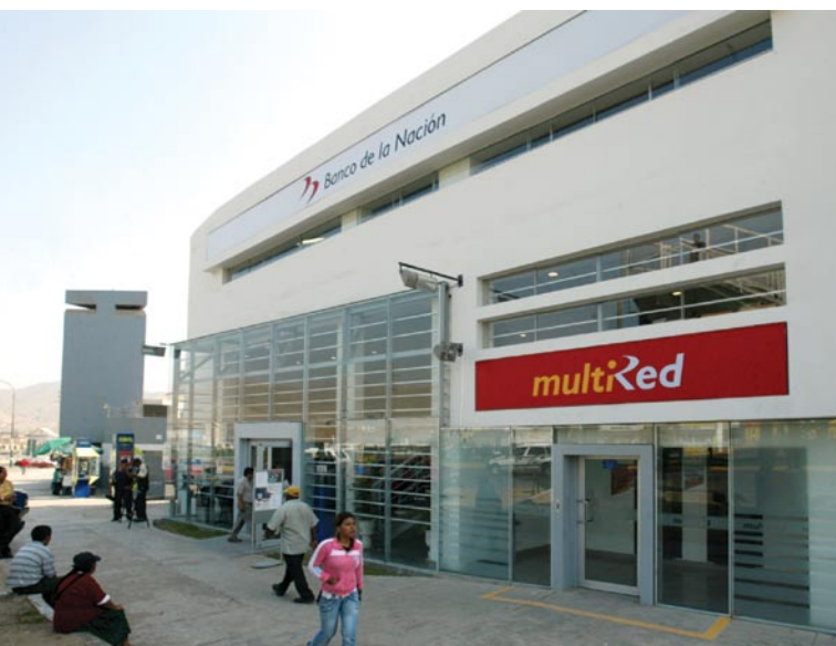
La agencia de Ventanilla cuenta ahora con un tercer nivel que le brinda más comodidad a los trabajadores y usuarios.