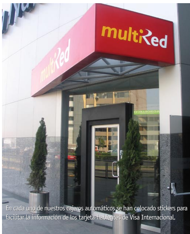
En cada uno de nuestros cajeros automáticos se han colocado stickers para facilitar la información de los tarjeta-habientes de Visa Internacional.

También se refirió al servicio de pago de tasas vía cajeros automáticos, el mismo que se pondrá en funcionamiento en las próximas semanas. Este servicio permitirá que los usuarios de Visa Internacional puedan hacer uso de sus tarjetas para pagar las ta-