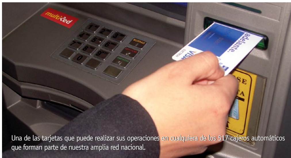
Una de las tarjetas que puede realizar sus operaciones en cualquiera de los 517 cajeros automáticos que forman parte de nuestra amplia red nacional.

En su discurso, el presidente García destacó la importancia del acuerdo y elogio el trabajo que viene realizando el Banco de la Nación a favor del proceso de bancarización del país y aseguró que este acuerdo es un gran paso a la modernidad y una simplificación enorme que se hace posible gracias al salto tecnológico que vive el mundo.