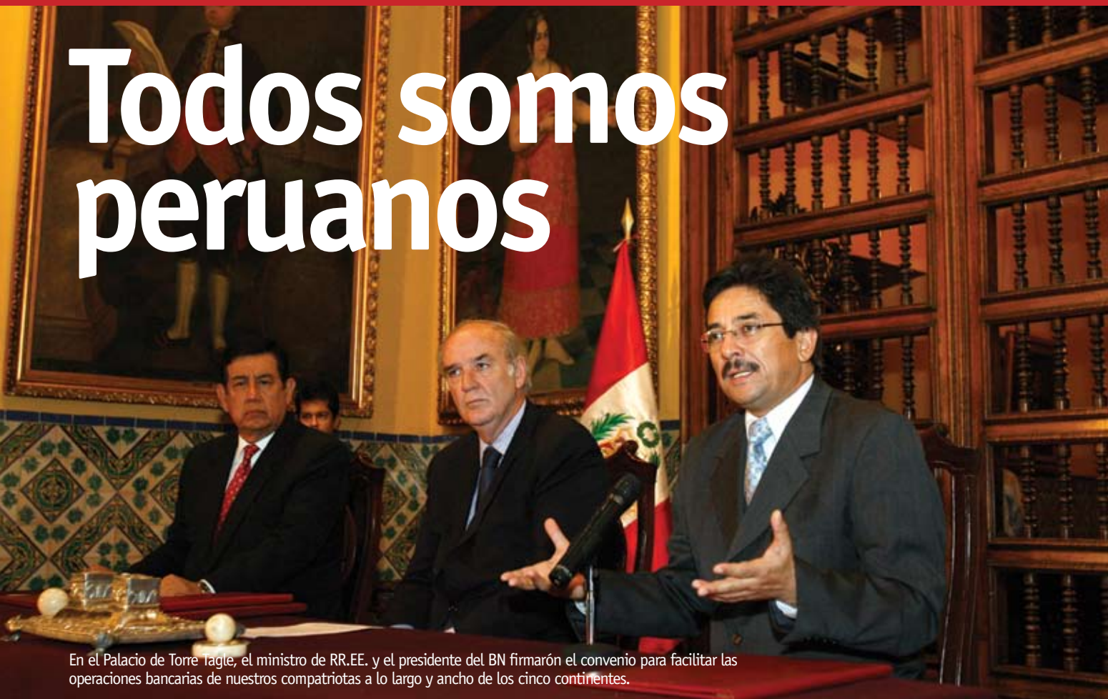
En el Palacio de Torre Tagle, el ministro de RR.EE. y el presidente del BN firmarán el convenio para facilitar las operaciones bancarias de nuestros compatriotas a lo largo y ancho de los cinco continentes.

E n cumplimiento de una oferta electoral del presidente Alan García, el pasado jueves 29 de marzo, el Ministerio de Relaciones Exteriores y el Banco de la Nación firmaron en el Palacio de Torre Tagle un Convenio de Cooperación Interinstitucional para facilitar el envío de dinero de los ciudadanos peruanos afincados fuera del país a través de sus bancos corresponsales en el exterior, los cuales acreditarán remesas familiares a costos competitivos, extenderán tarjetas de débito al titular y allegados aquí y en el extranjero y emitirán tarjetas de crédito también al titular y adicionales en el lugar que el tarjeta habiente titular escoja. Años atrás, para cualquier ciudadano peruano residente en el exterior era una tarea casi hercúlea el simple hecho de coger