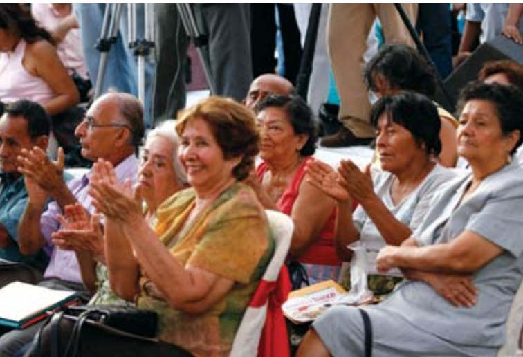
Pensionistas de la ONP aplauden el lanzamiento del Préstamo Multired que les permitirá créditos hasta 19 mil nuevos soles.

Más de 350 mil pensionistas dependientes administrativamente de la Oficina de Normalización Previsional, quienes cobran mensualmente en las casi 400 agencias que el Banco de la Nación tiene a lo largo y ancho del país acceden desde el miércoles 11 de abril a créditos que van desde los 300 nuevos soles hasta los 19 mil nuevos soles a través del novísimo producto Préstamo Multired Pensionistas.