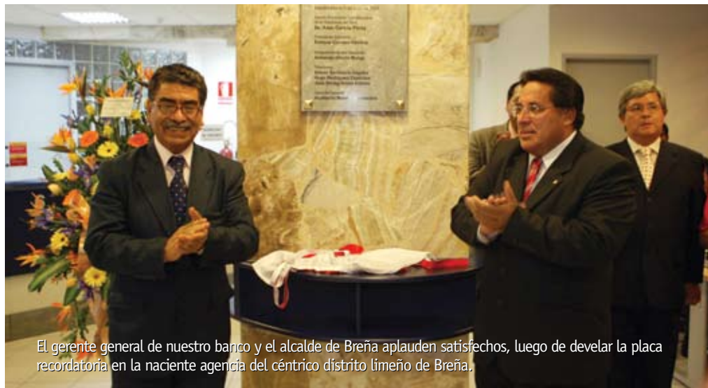
El gerente general de nuestro banco y el alcalde de Breña aplauden satisfechos, luego de develar la placa recordatoria en la naciente agencia del céntrico distrito limeño de Breña.

El 3 de abril, el Banco de la Nación inauguró su agencia número 397 en el tradicional distrito de Breña. Se estima que en ella se realizarán 31 mil operaciones mensuales y se atenderá a los usuarios de Breña y de los distritos aledaños.