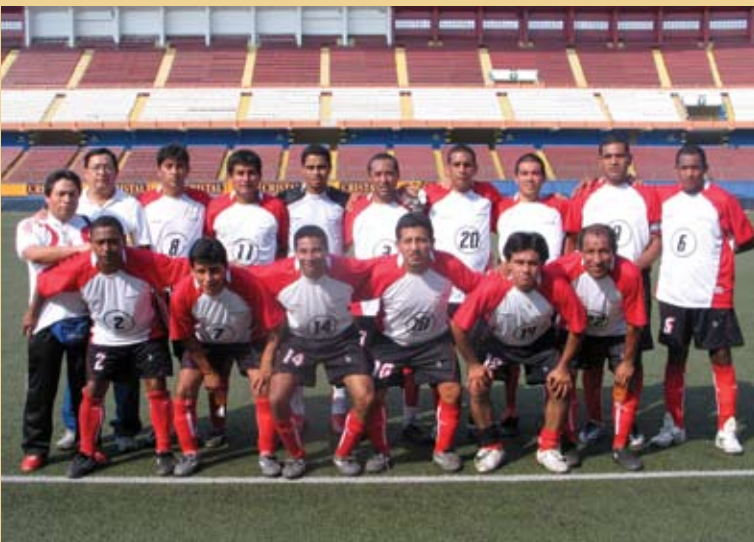
Los blanquirojos de nuestro banco posan antes de enfrentarse al competitivo equipo de Scotiabank.

Para los trabajadores de nuestro banco, el cuarto mes del año es el de la culminación del Campeonato Nuestros Valores, el de la definición del Torneo de Fulbito Femenino y el de la inauguración del Campeonato Interbancario de Fútbol. A todo gol.