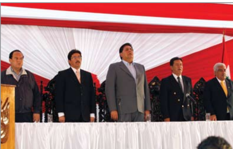
El presidente de la República, el ministro del Interior, el presidente ejecutivo del BN, el jefe de la ONP y el presidente de la Región Piura, entonan el Himno Nacional durante la ceremonia.

E n la cálida ciudad de Piura, el presidente de la República, Alan García Pérez, anunció el pasado 11 de abril la formalización del convenio entre la Oficina de Normalización Previsional (ONP) y el Banco de la Nación que dio origen al Préstamo Multired Pensionistas, destacando que tras estar “amarrado” por quince años, el Banco de la Nación había otorgado préstamos por 600 millones de nuevos soles a los empleados públicos de menores recursos. Indicó que con la inclusión de los jubilados, la cifra se elevaría considerablemente.