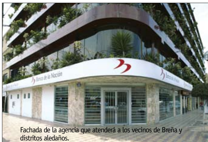
Fachada de la agencia que atenderá a los vecinos de Breña y distritos aledaños.

habían tenido que desplazarse a la Agencia de Aeronáutica situada a un kilómetro del borde oriental de Breña, a la sucursal de Pueblo Libre ubicada a dos kilómetros de la frontera sur del distrito o a la Sucursal 28 de Julio localizada a