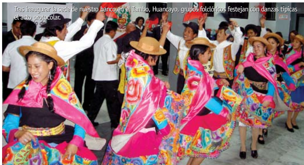
Tras inaugurar la sede de nuestro banco en el Tambo, Huancayo, grupos folclóricos festejan con danzas típicas el acto protocolar.

Una delegación de la alta dirección de nuestro banco realizó una serie de actividades en la Ciudad Incontrastable. Una de ellas fue la Clase Magistral dictada por nuestro presidente en la Universidad Nacional del Centro del Perú.