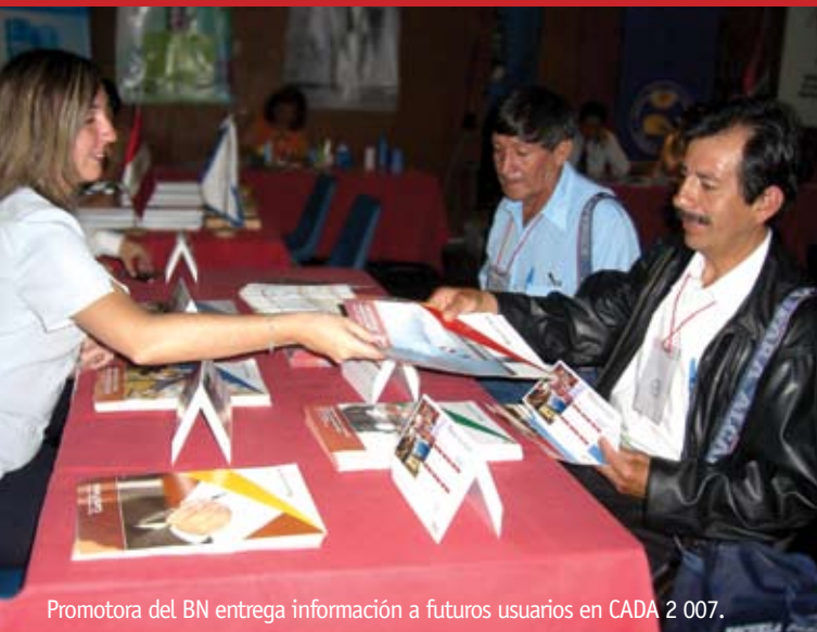
Promotora del BN entrega información a futuros usuarios en CADA 2 007.

Soto, miembro titular del JNE, se trataron los retos que enfrentan las autoridades elegidas en noviembre pasado. Bajo el lema "Nueva gestión... nuevos retos", los participantes procedentes de todo el Perú pudieron informarse de los pasos que tienen que dar para poder cumplir con las promesas realizadas a sus electorados. En esa línea, el Banco de la Nación instaló un stand donde informó a los interesados sobre la amplia gama de productos que ofrece para gobiernos regionales y municipales.